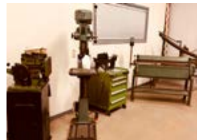
ALTIJD STERK IN MACHINES EN GEREEDSCHAPPEN