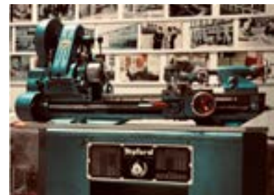
MYFORD DRAAIBANK IN HET MUSEUM